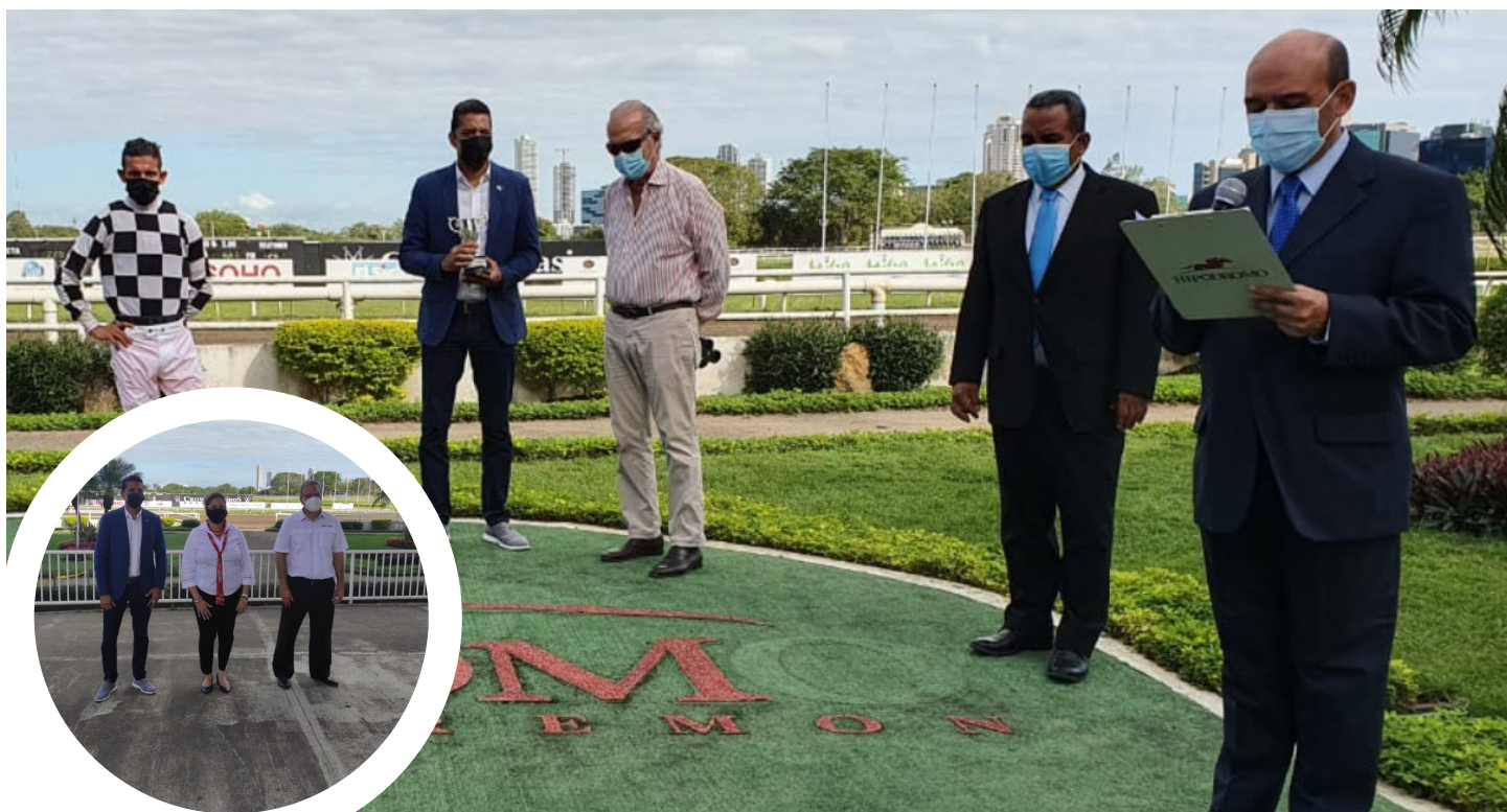
El Administrador General Pedro Castillo realiza entrega a el ganador de la carrera Invitacional