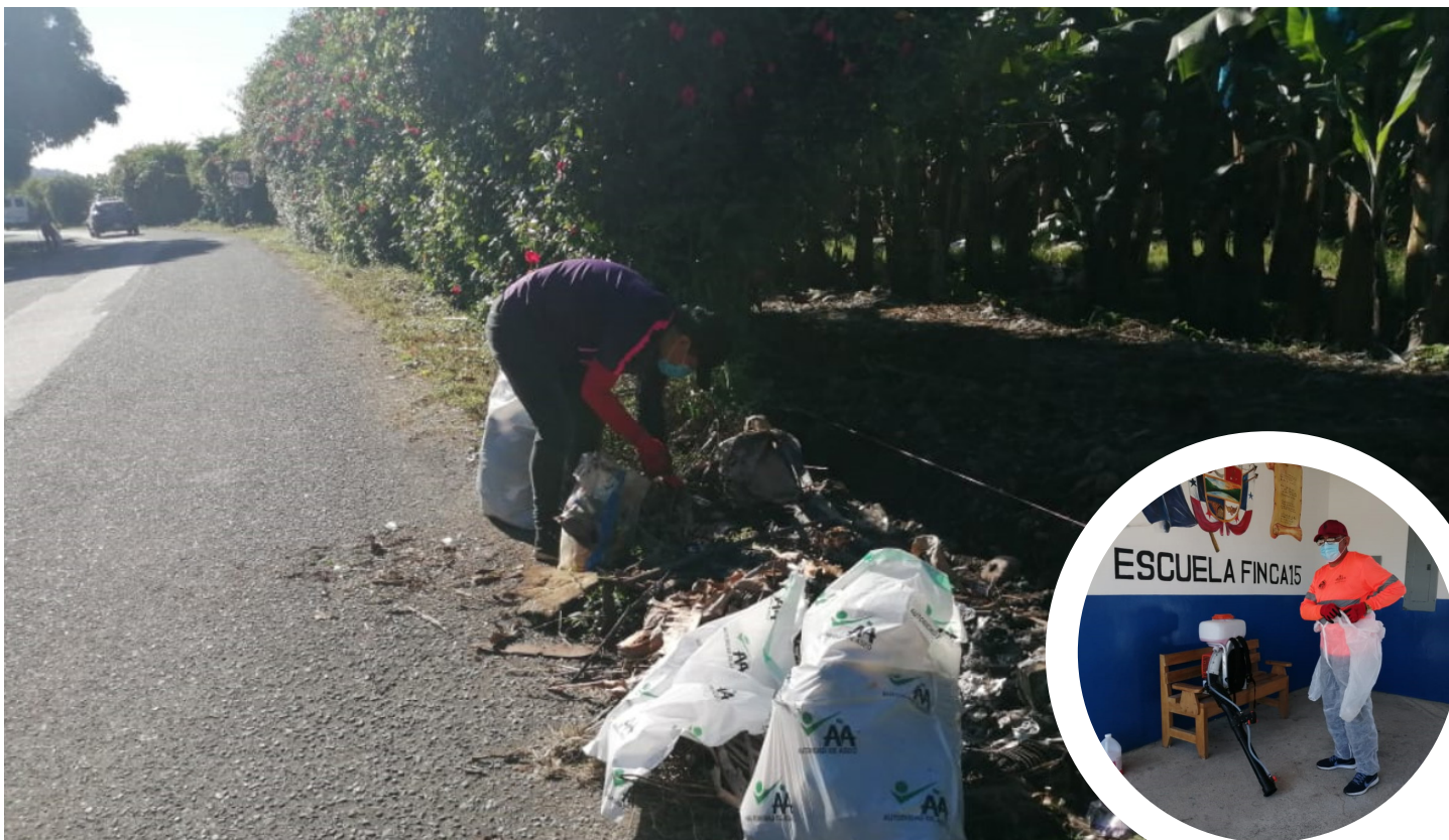
Jornada de limpieza en Finca 15